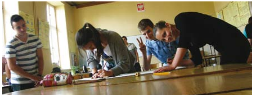
Młodzież uczestniczy w zajęciach uczących jak pomagać swoim rówieśnikom.

„W grupie najbardziej ujmuje mnie wspólny zamiar czynienia czegoś dobrego.” /Agnieszka S./