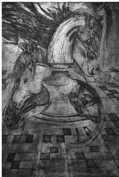
Głównym tematem prac Aleksandry Mazur-Wilk są konie.

Muzeum Drukarstwa (ul. Głęboka 50) zaprasza do odwiedzin Galerii „Przystanek Grafika”, w której do 16 listopada prezentowane będą prace Aleksandry Mazur-Wilk na wystawie „To tylko konie”.