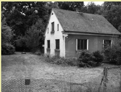
Nieruchomość przeznaczona do sprzedaży przy ul. Frysztańskiej 155.

Burmistrz Miasta Cieszyna ogłasza, że w dniu 05.11.2012 r. o godz. 10.00 odbędzie się ustny przetarg nieograniczony na sprzedaż nieruchomości oznaczonej jako