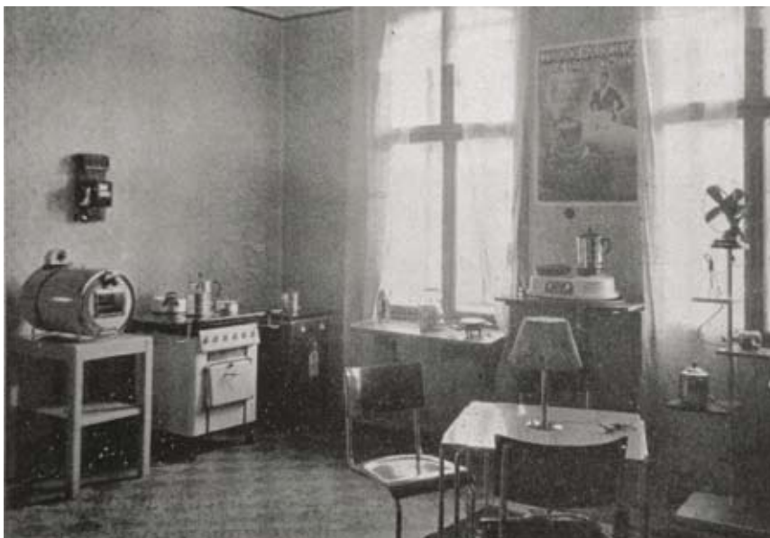
Lokal propagandowy Elektrowni Okręgowej Miasta Cieszyna.