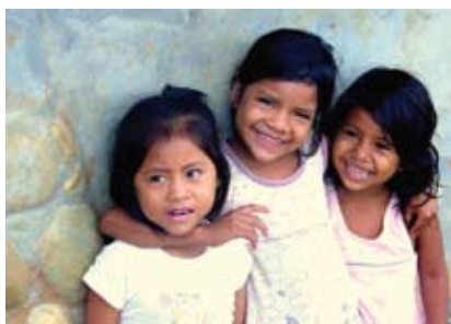
Opowieść o codzienności w amazońskiej dżungli usłyszymy w COK

Amazonia to obszar świata, gdzie deszcz pada przez 6 miesięcy w roku, robaki są przysmakiem, sportem łapanie anakondy, dzieci biegały boso, a życie białego człowieka obfituje w zaskakujące i niezapomniane przygody.