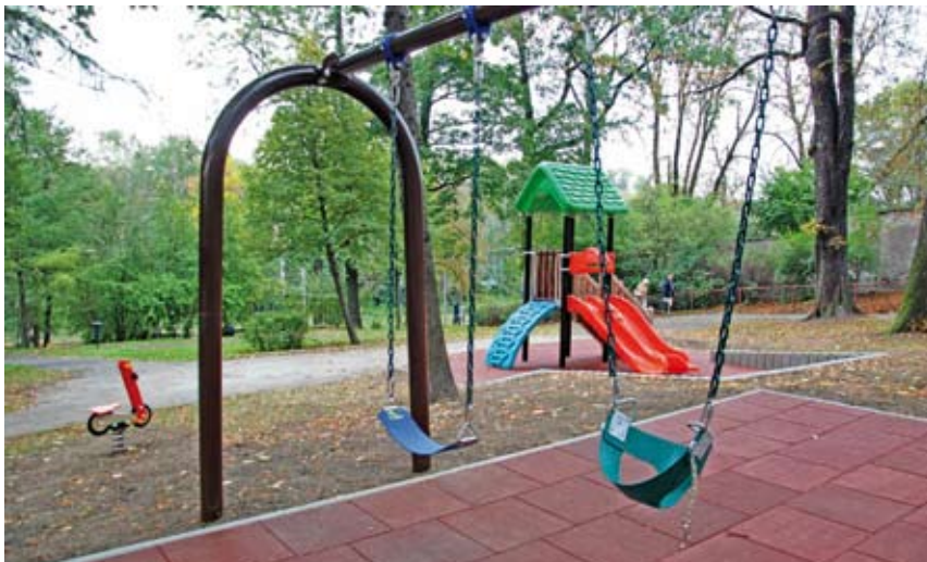
Dzieci mogą już korzystać z nowego placu zabaw przy Kościele św. Trójcy.