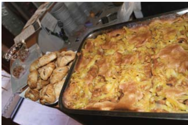
Jeden z przysmaków kuchni żydowskiej.