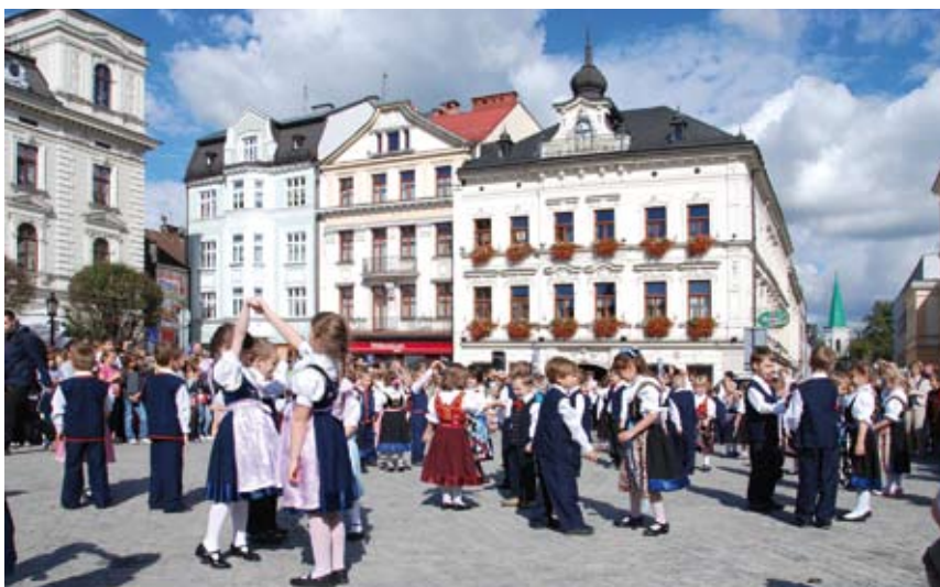
Dzieci z radością tańczyły i śpiewały na cieszyńskim Rynku.

Już po raz ósmy, w piątek 28 września na cieszyński rynek przybyły tłumy młodych śpiewaków i tancerzy, aby wziąć udział w kolejnej edycji imprezy pod nazwą „Śpiewajmy Razem”. Wydarzenie to było nieoficjalną inauguracją „Skarbów z cieszyńskiej trówały”, które w tym dniu rozpoczęły swój bieg. Organizatorem imprezy był Wydział Kultury i Turystyki Urzędu Miejskiego w Cieszynie, który składa serdeczne podziękowania dyrekcjom i nauczycielom szkół podstawowych oraz przedszkoli, ale przede wszystkim ogromne brawa kieruje w stronę młodych uczestników śpiewaczego i tanecznego spotkania, za przygotowanie i tak liczny udział w imprezie. Wydział Kultury i Turystyki