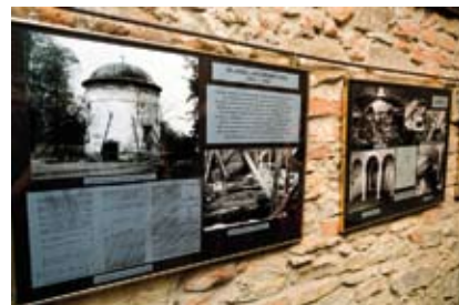
Ekspozycja koncentruje się na wczesnym średniowieczu na Górze Zamkowej.

Największym atutem wystawy jest dokumentacja fotograficzna wykonana w trakcie badań, do tej pory nie publikowana, dlatego też słabo znana wśród mieszkańców Cieszyna. Fotografie