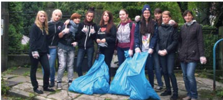
W ramach akcji „Sprzątanie Rezerwatów Przyrody” zebrano 50 stulitrowych worków śmieci.