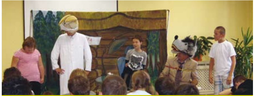
Ważne współczesne problemy przedstawione zostały poprzez zabawne scenki rodzajowe.

Wsparciem edukacyjnym i uzupełnieniem działań terapeutycznych prowadzonych w Bibliotece są z pewnością formy wizualizacyjne, parateatralne i teatralne, których realizację wspiera finansowo MOPS w Cieszynie. W ramach takiego właśnie programu i dzięki pomocy finansowej MOPS-u 2 października wystawiony został w siedzibie Biblioteki Miejskiej w Cieszynie spektakl teatralny o charakterze profilaktycznym w wykonaniu krakowskiego Studia Małych Form Teatralnych, Scenografii i Reżyserii Art-Re pt. „Wilk i zając”.