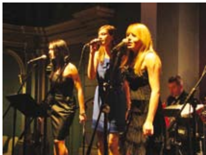
Grzybowski Band uświetni obchody rocznicy powołania Rady Narodowej Księstwa Cieszyńskiego.

19 października 2012 mija 94 rocznica powołania Rady Narodowej Księstwa Cieszyńskiego.