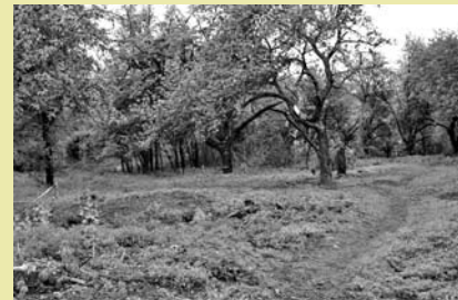
Nieruchomość gruntowa przy ul. Stokrotek przeznaczona na sprzedaż.

Szczegółowe ogłoszenie o przetargu zostało zamieszczone na stronie internetowej www.um.cieszyn.bip-gov.info.pl , miasto-