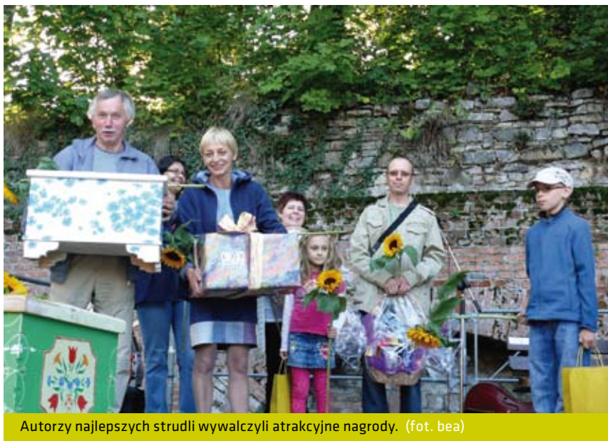
Autorzy najlepszych strudli wywalczyli atrakcyjne nagrody.