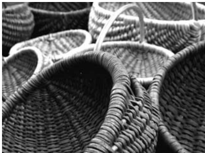
Młodzież i dorosłych zapraszamy do nauki wyplatania z wikliny.

Wierzba w tradycji ludowej, dzięki swojej żywotności, symbolizuje wiecznie odradzające się życie. Drzewo to rośnie niemal w każdych warunkach, a gałązka wierzbową wetkniętą w ziemię z dużym prawdopodobieństwem przyjmie się i zazieleni. W Polsce wciąż kultywujemy związane z nią tradycje. Dom Narodowy i Stowarzyszenie Serfenta proponują wyplatanie z wikliny - czyli z żywej, pachnącej wierzby!