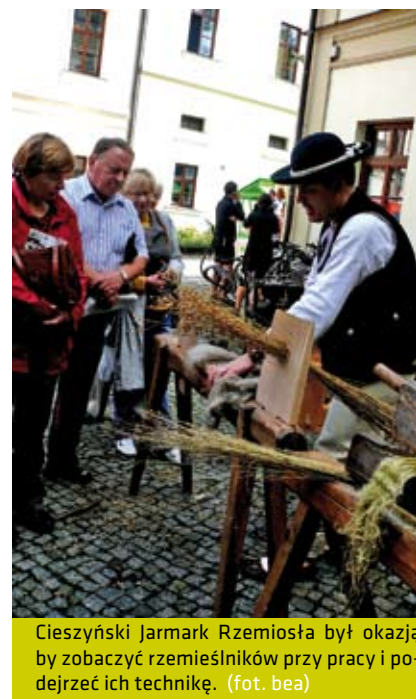
Cieszyński Jarmark Rzemiosła był okazją by zobaczyć rzemieślników przy pracy i pojąć ich technikę.