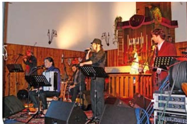
Podczas koncertu inauguracyjnego festiwal.

W dniach 3-7 października w Cieszynie i Czeskim Cieszynie odbyły się Dni Kultury Żydowskiej. Były okazją uczestniczenia w wielu interesujących imprezach, m.in.: koncertach Bydgoszcz Klezmer Band, słowackiego Preßburger Klezmer Band i Zespołu Tańca Żydowskiego Klezmer, a także wykładach, prelekcjach, pokazach filmów, spektaklach, war-